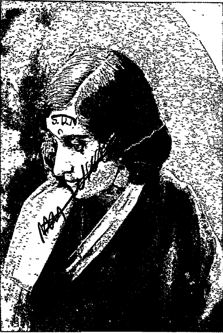
कुमारी इंदिरा नेहरू /